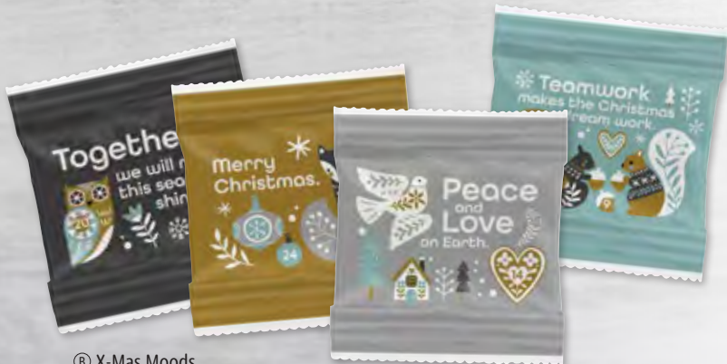
8 X-Mas Moods