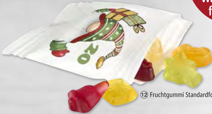
12 Fruchtgummi Standardform Weihnachten

Ein echter Hingucker – unser menschengroßer Fruchtgummi-Ketten- Adventskalender mit Wandbe- festigung